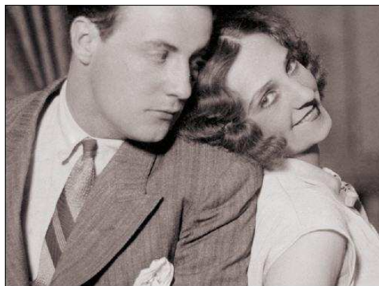
I coniugi Heesters.