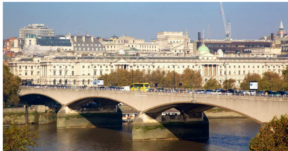
Il ponte Waterloo

Milioni di persone sciamano come mosche intorno alla metropolitana di Waterloo Terry e Julie attraversano il fiume Dove sono sani e salvi E non hanno bisogno di amici Finché ammirano il tramonto sul Waterloo, sono in paradiso.