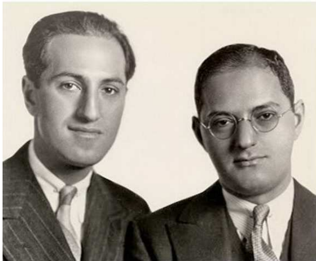
George & Ira Gershwin

Song di George Gershwin (m.) e Ira Gershwin (t.), composto nel 1924 e inserito in vari spettacoli di varietà e film. L'interpretazione consigliata è quella Lena Horne (Bedford-Stuyvesant, 1917 - New York, 2010), incisa nel 1941 e ascoltabile in https://www.youtube.com/watch?v=aJ5bbeypX2A .