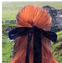
The black velvet band

I suoi occhi brillavano come diamanti La credevo la regina del paese E i suoi capelli le scendevano sulle spalle Legati con un nastro di velluto nero