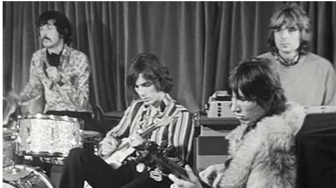
I Pink Floyd all'epoca dell'incisione del disco Columbia DB 8401 (1968).