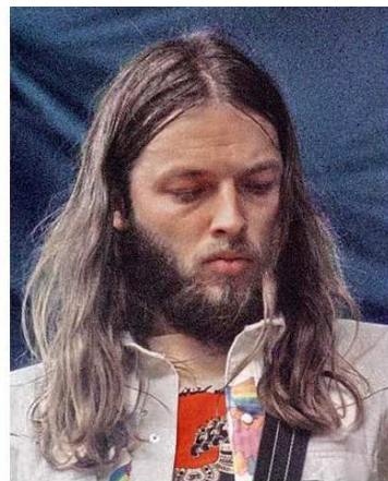
Roger Waters e David Gilmour.