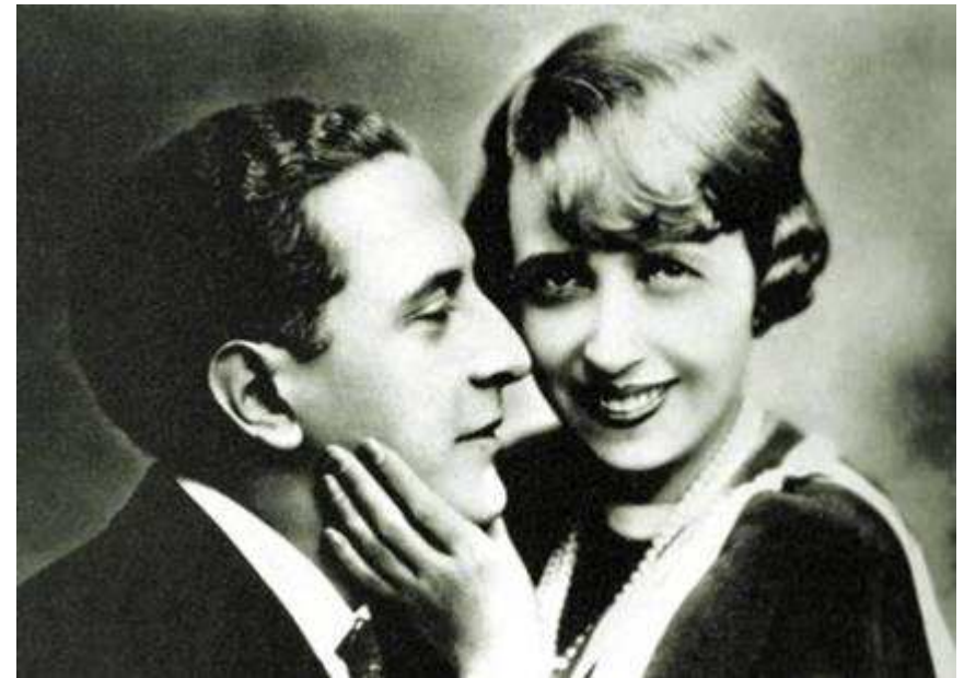
A sinistra: nei primi anni Venti; al centro: con Jenny Golder nel 1926; a destra: Spadaro e Mistinguette nel 1927.