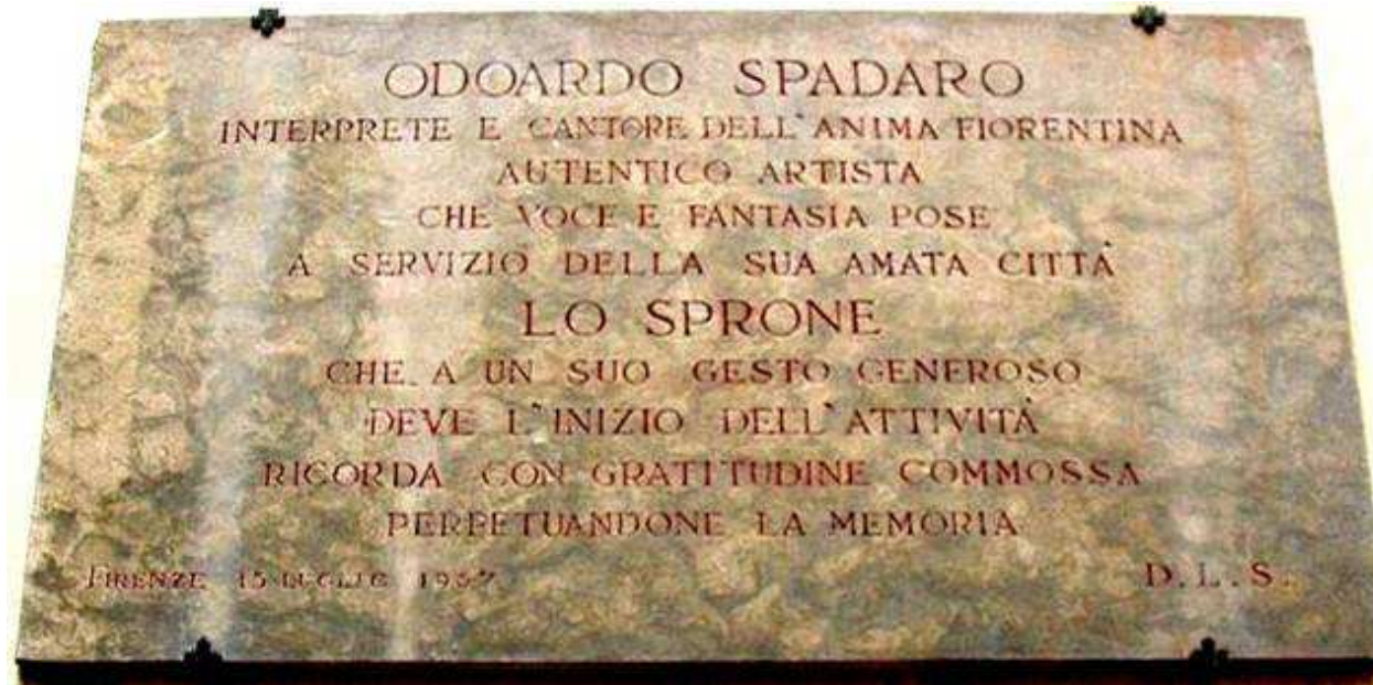
Targa in onore di Spadaro posta il 15 Luglio 1967 in Piazza del Giglio a Firenze.