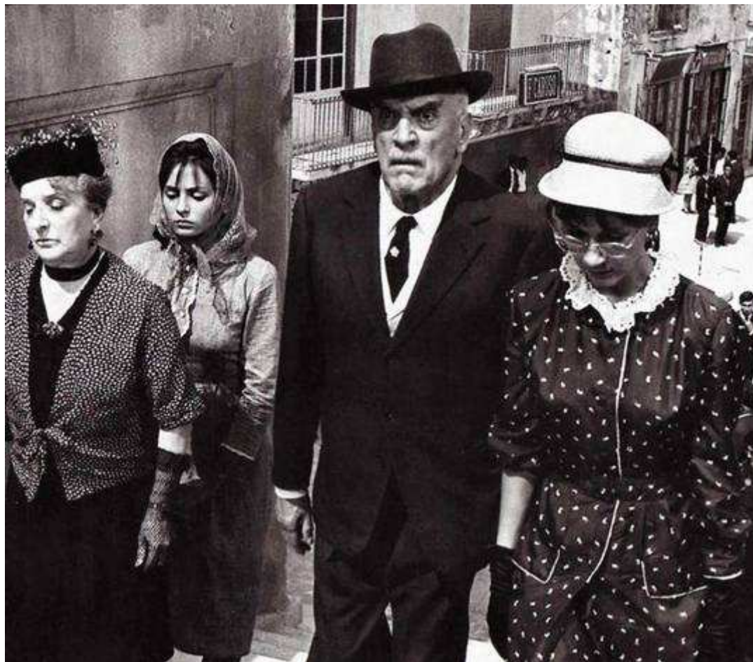
A sinistra: Spadaro nel 1960; A destra: Spadaro al centro nel film Divorzio all'italiana (1961).