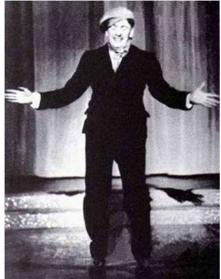
A sinistra: nel 1933; al centro: nella seconda metà degli anni Trenta; a destra: nella rivista Quarantuno ma non li dimostra! (1940).