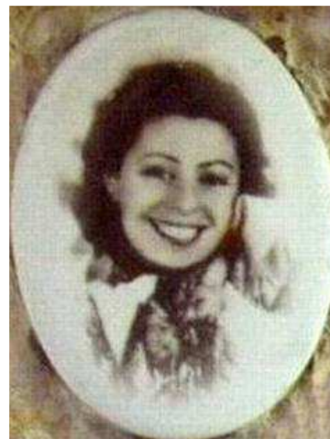
Foto sulla tomba.