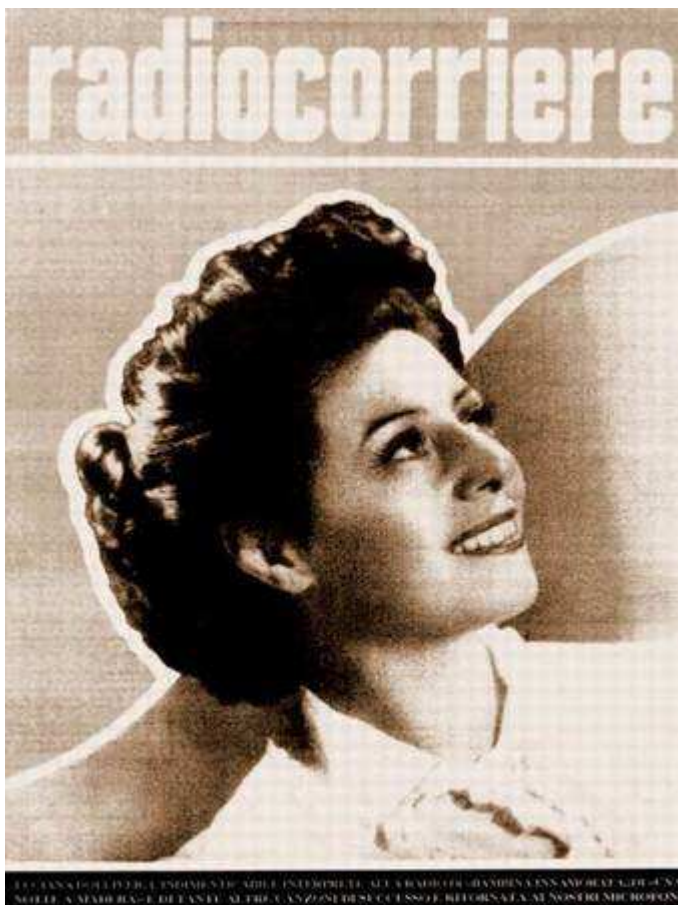
Copertina del «Radiocorriere» del 19 Marzo 1949.