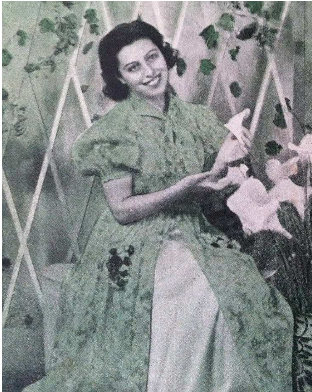
Foto sulla copertina di «Canzoni della Radio», a. I, n. 10, 15 Luglio 1945.