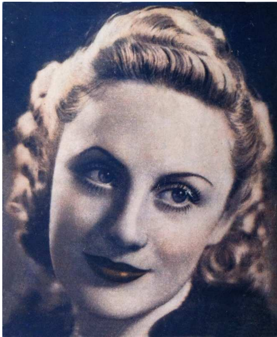
Foto sulla copertina di «Canzoni della Radio», a. I, n. 19, 1° Dicembre 1945.