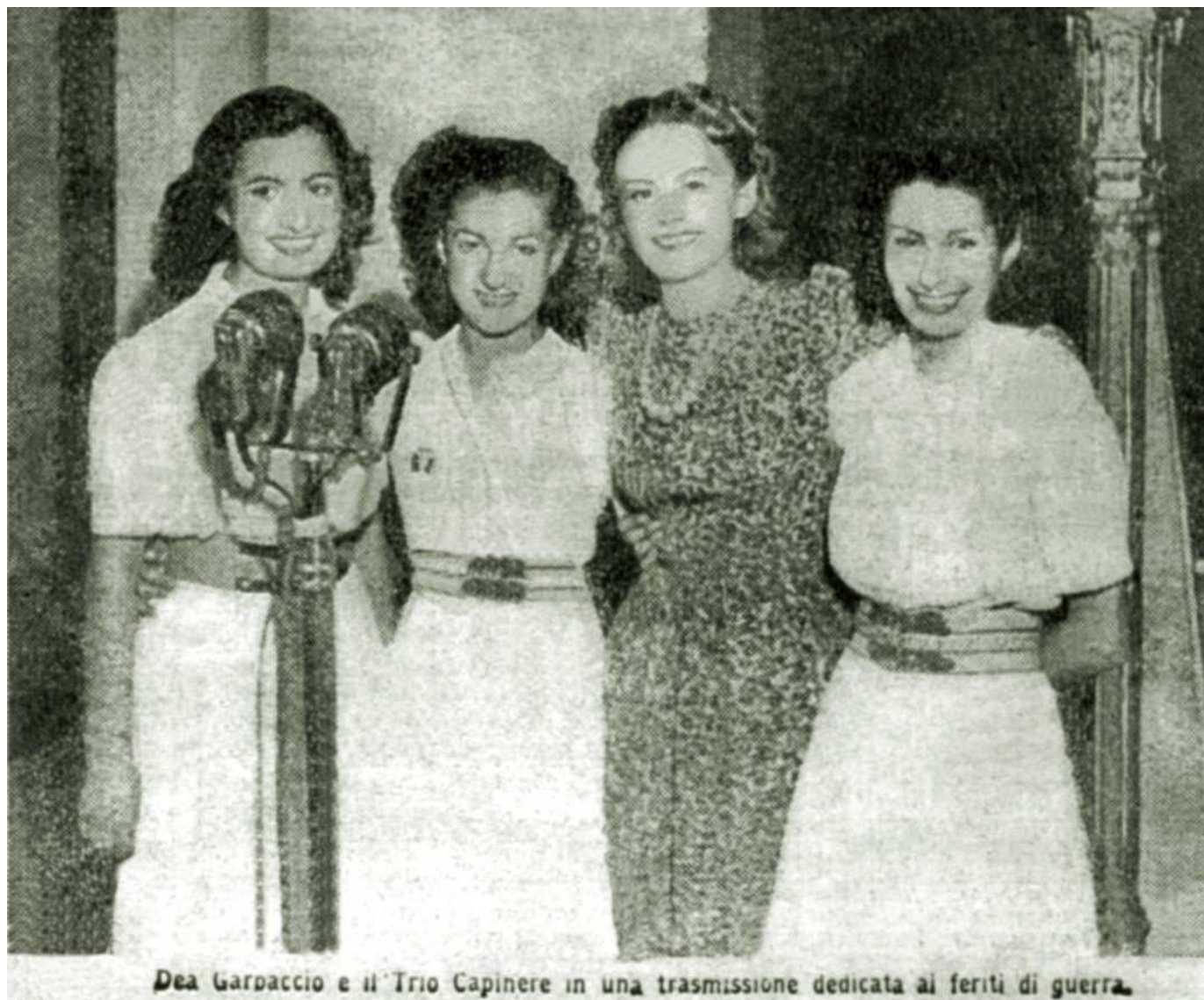
Dal «Radiocorriere» del 12 settembre 1943.