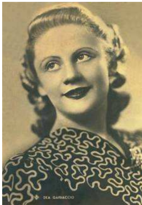
Cartolina ASER (1940 circa).