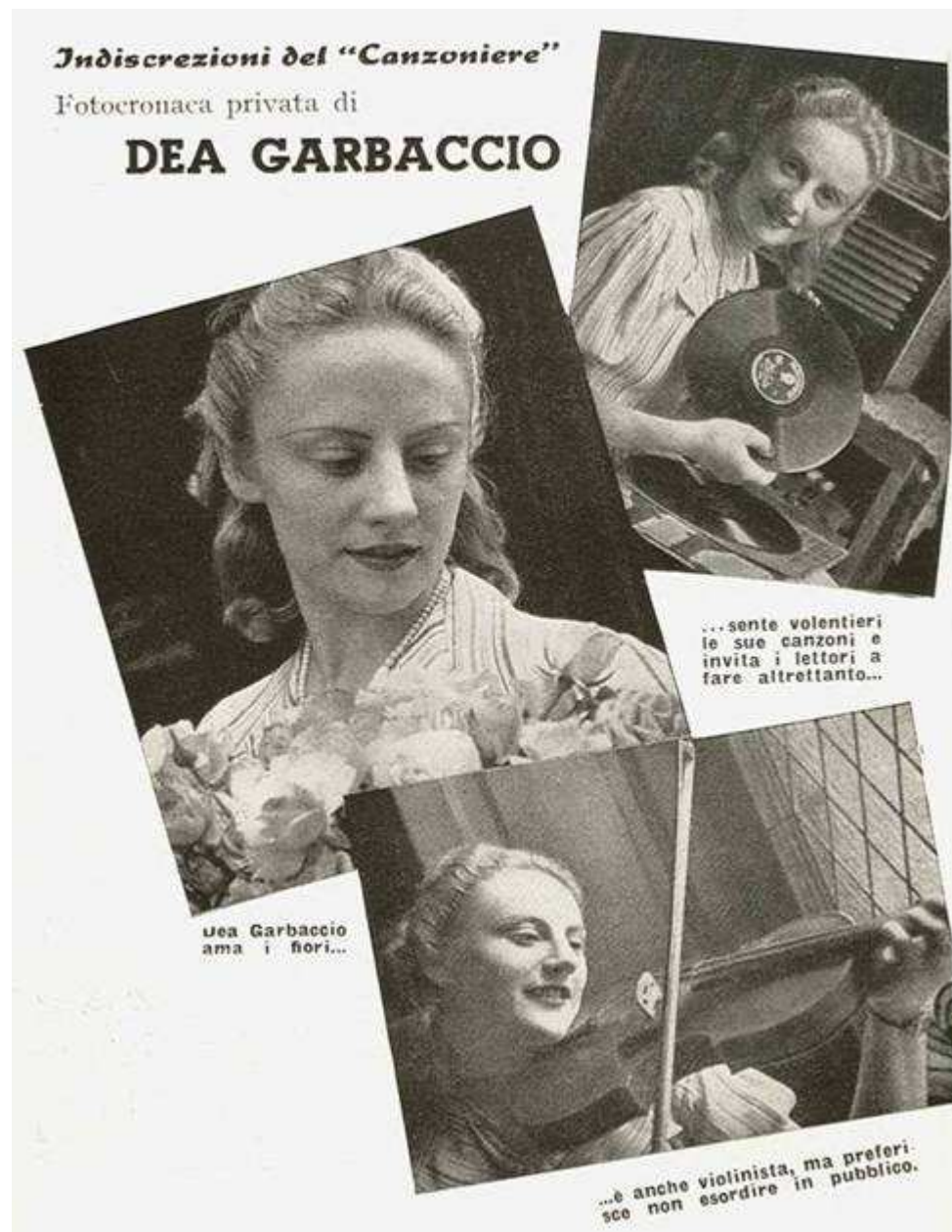
«Il Canzoniere della Radio», n. 44, 15 Settembre 1942, p. 27.