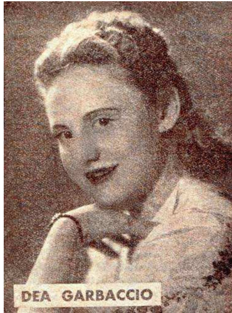
Dal fascicolo di I. Ribolzi, Nel Regno della Radio (Gennaio 1943).