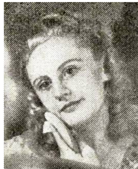
Dal «Canzoniere della Radio», nn. 42 e 50 (1942).