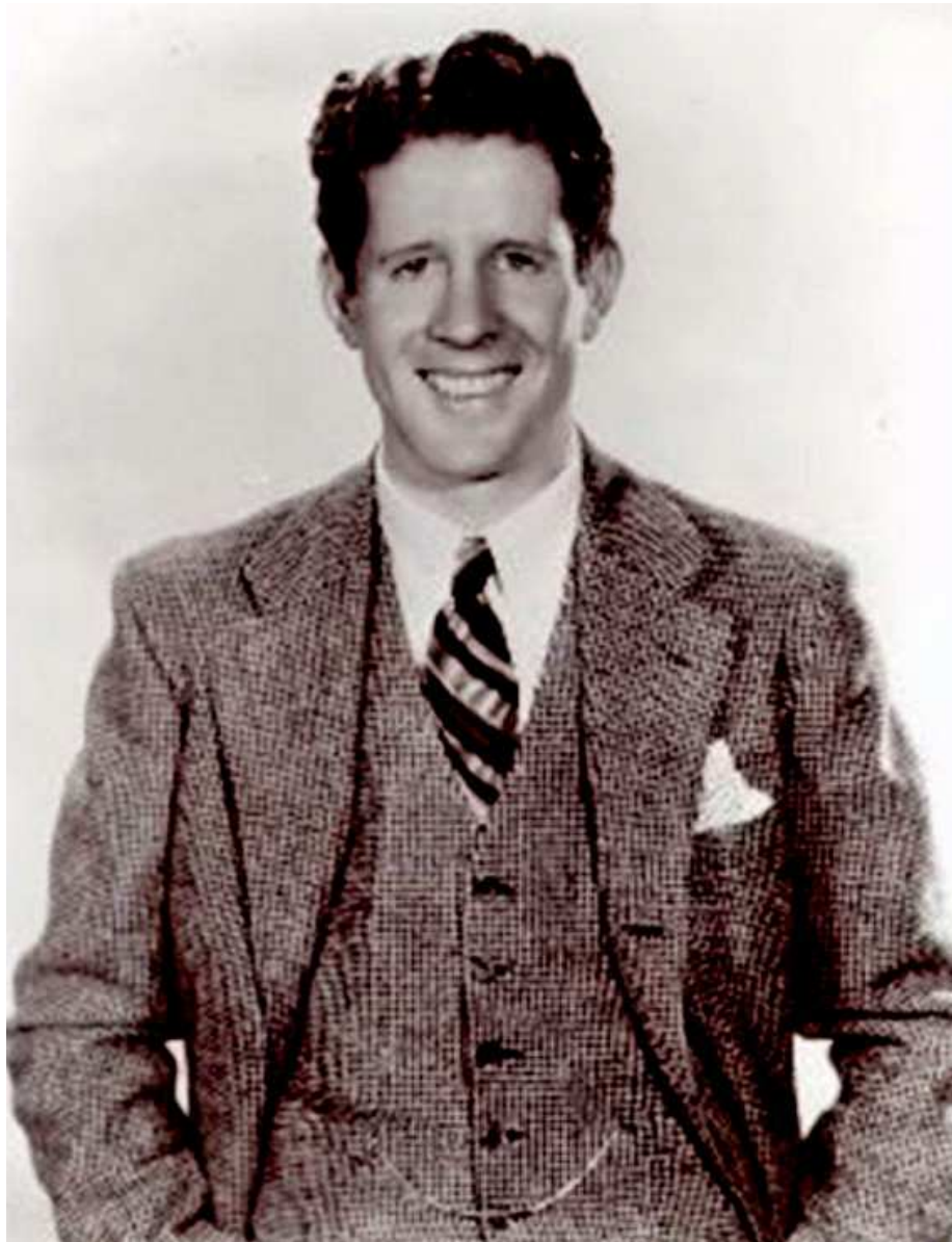
Rudy Vallée (Island Pond, 1901 - North Hollywood, 1986)