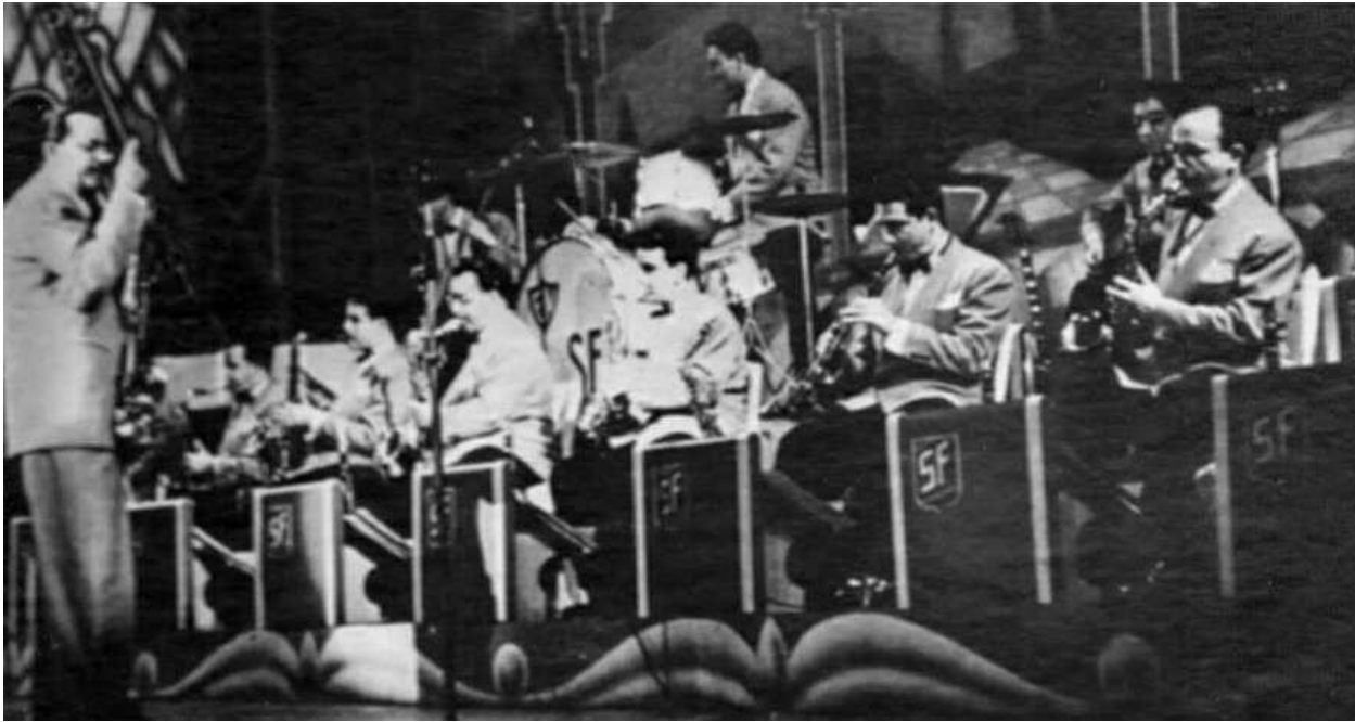
Shep Fields and His New Music.