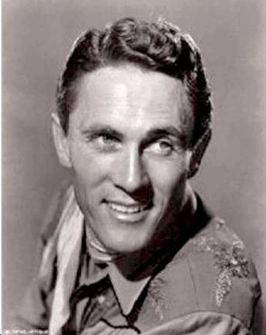
Ken Curtis (Lamar, Colorado, 1916 - Fresno, California, 1991)