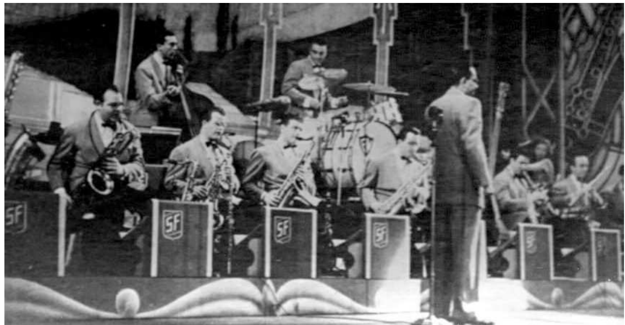
The All-Reed Orchestra.