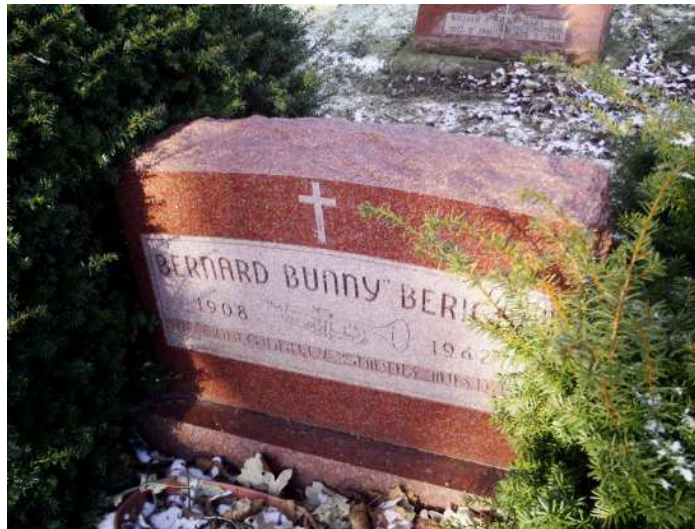
Tomba di Bunny Berigan nell’Annunciation Cemetery, Fox Lake, Dodge County, Wisconsin, USA.

Obbligato a rientrare nei ranghi con Tommy Dorsey, è tuttavia piagato da gravissimi problemi di alcolismo. Tenta disperatamente di continuare a suonare per mantenere la sua famiglia, ma la cirrosi epatica ne decreta la fine prematura a soli 34 anni.