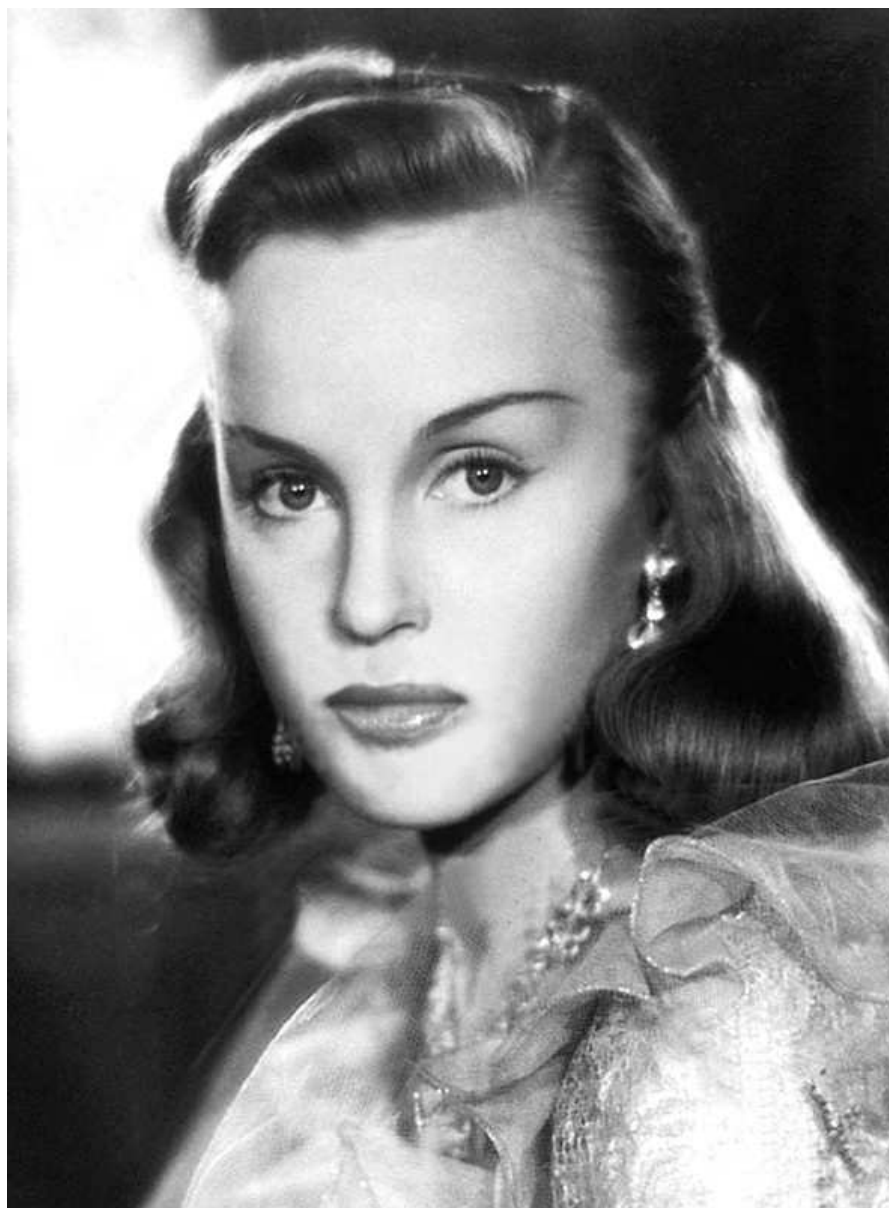
In Aquila nera di Riccardo Freda, 1946.