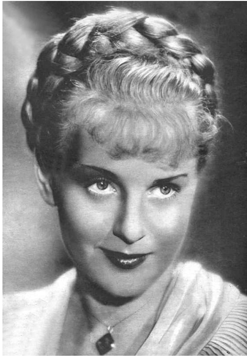
Nel film La figlia del capitano di Mario Camerini, 1947.