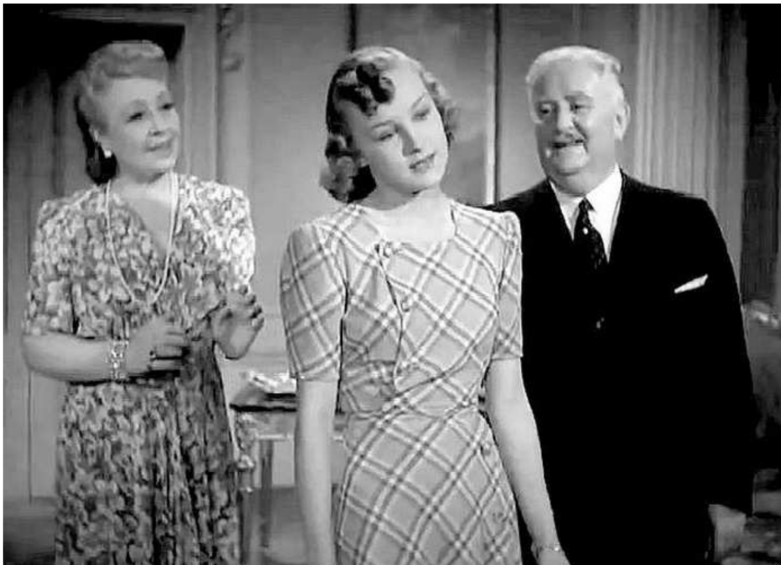
Con Olga Vittoria Gentili e Guglielmo Barbabò in Teresa Venerdì di Vittorio De Sica, 1941.