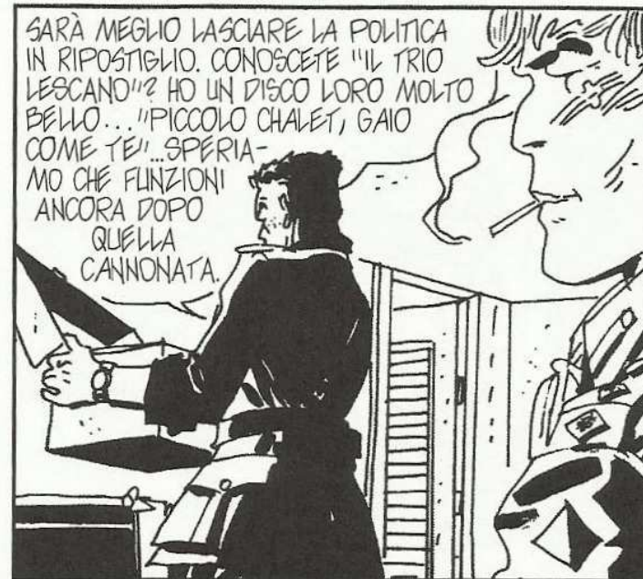
Vignetta 5 di p. 21.