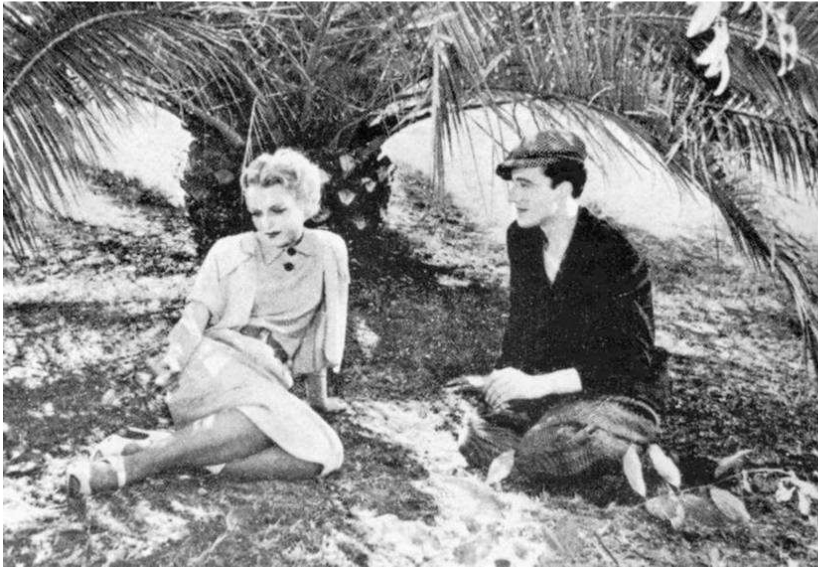
Vittorio De Sica con Assia Noris in Darò un milione di Mario Camerini (1935).