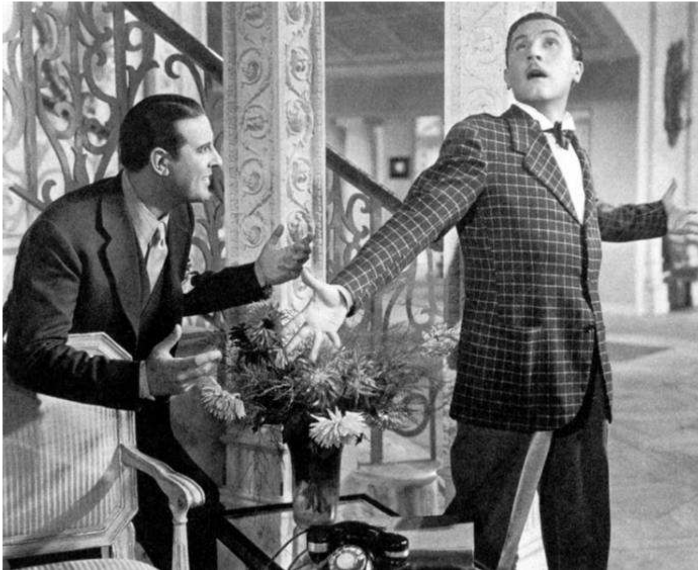
Alberto Rabagliati con Paolo Stoppa in Una famiglia impossibile di Carlo Ludovico Bragaglia (1940).