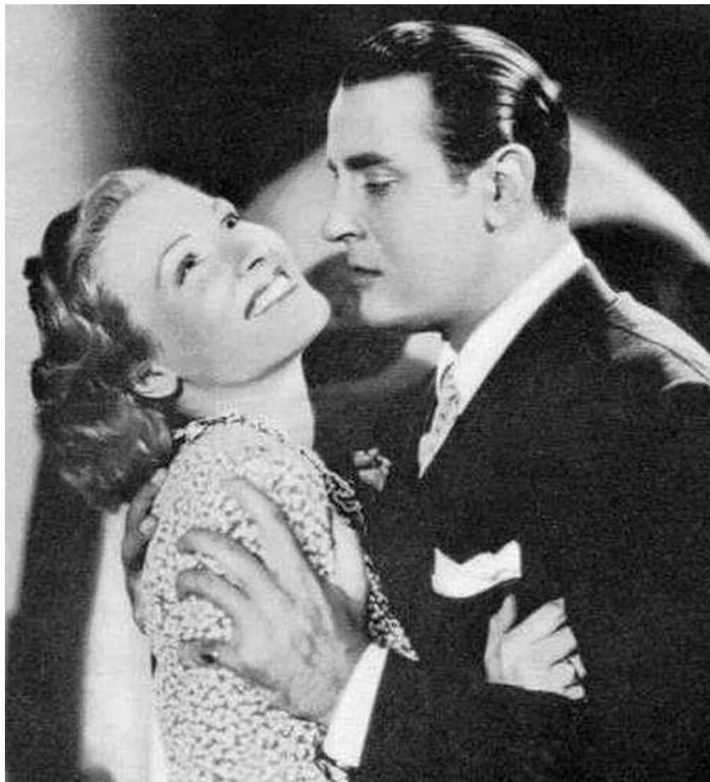
Alberto Rabagliati con Vivi Gioi in Lascia cantare il cuore di Roberto Savarese (1943).