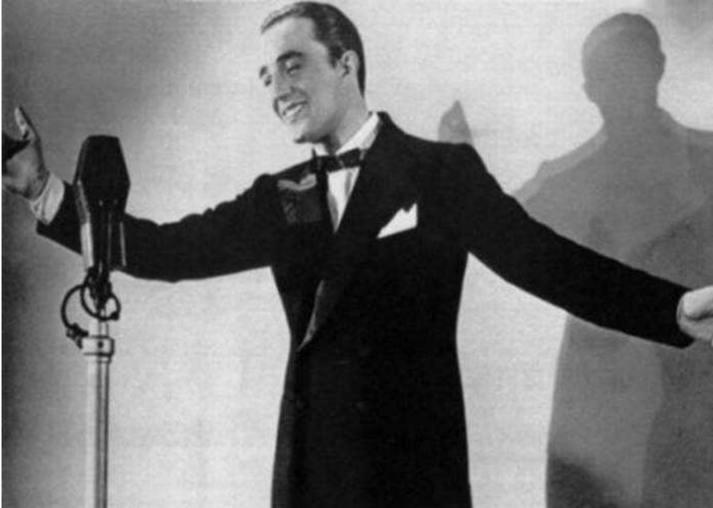
Vittorio De Sica in La mazurca di papà di Oreste Biancoli (1938).