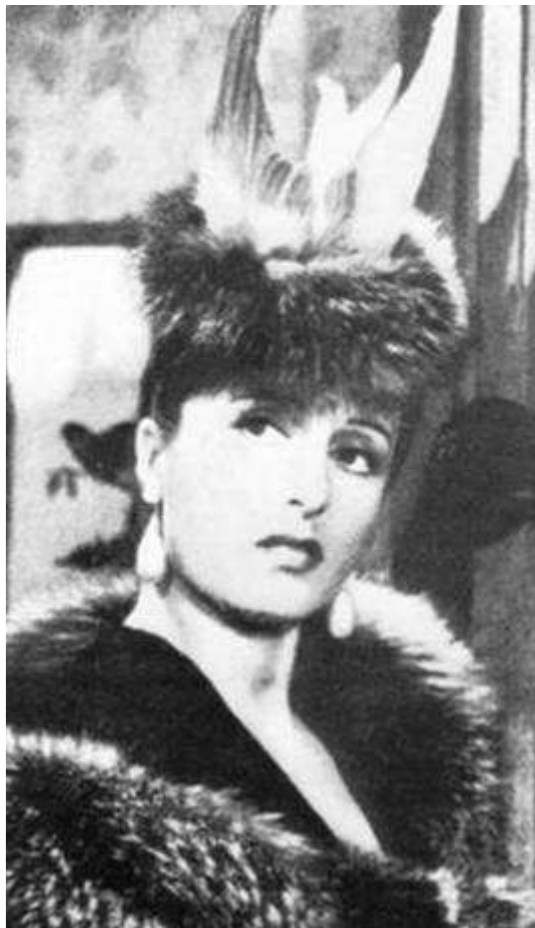
Anna Magnani nel ruolo della sciantosa in Teresa Venerdì di Vittorio De Sica (1941).