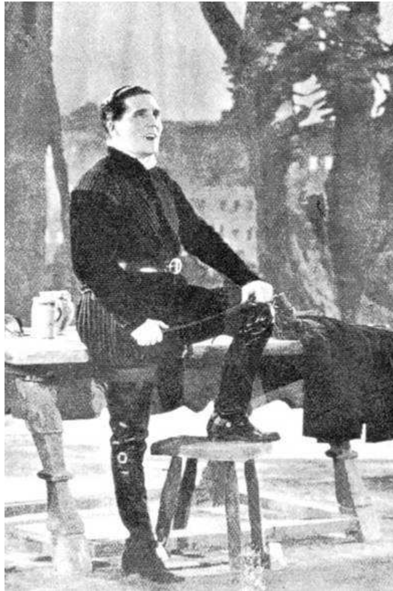
Giovanni Manurita in L'allegro cantante di Gennaro Righelli (1938).