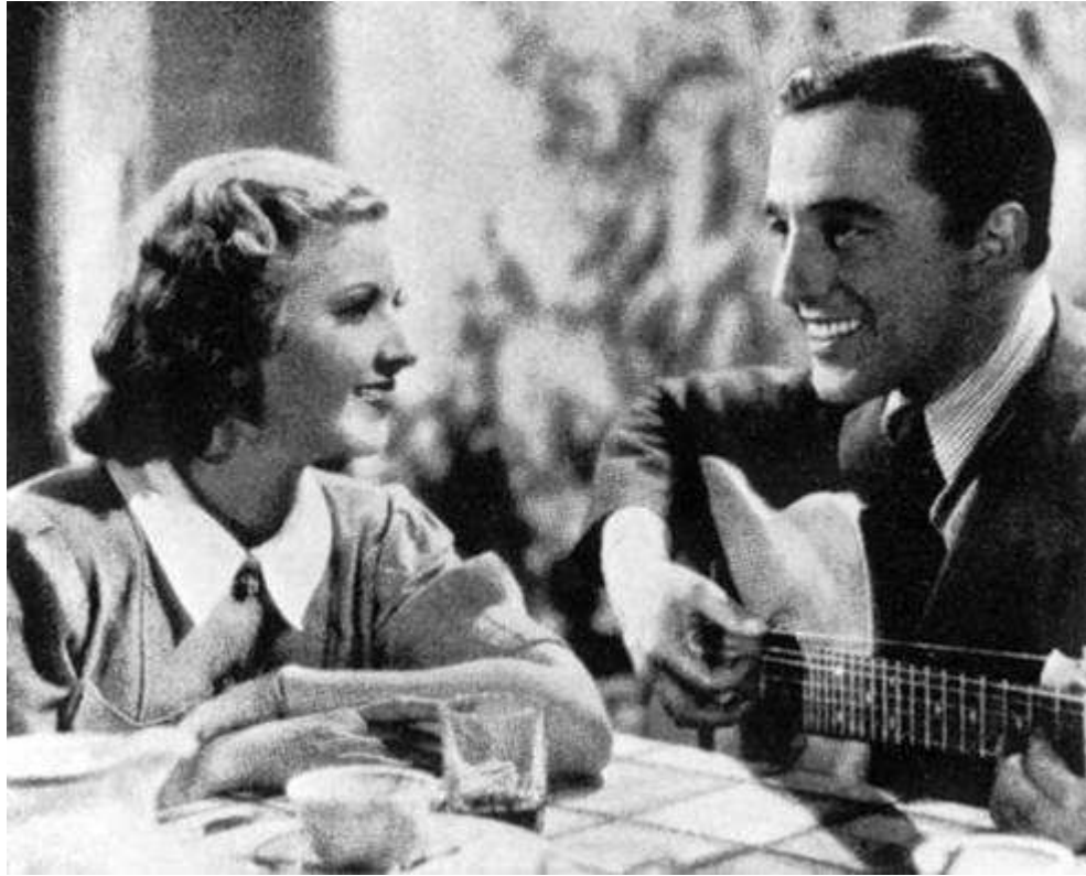
Vittorio De Sica con Silvana Jachino in Partire di Amleto Palermi (1938).