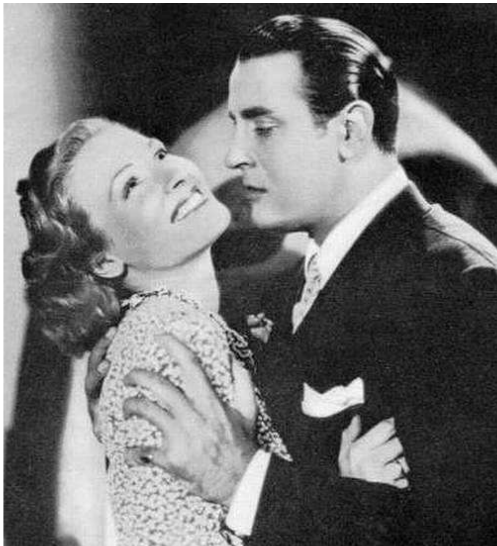
Alberto Rabagliati con Vivi Gioi in Lascia cantare il cuore di Roberto Savarese (1943).