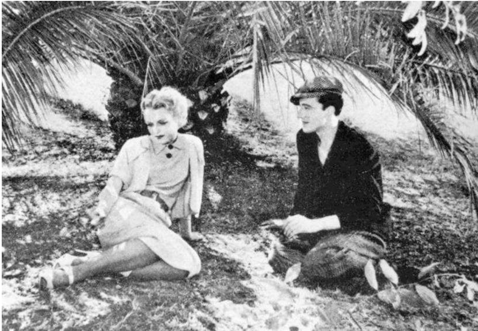
Vittorio De Sica con Assia Noris in Darò un milione di Mario Camerini (1935).